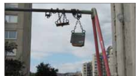
limited space