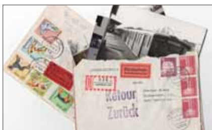
limited space © STEFAN WIESE/ Sungeun Kim