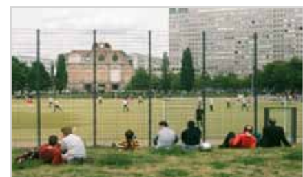
limited space