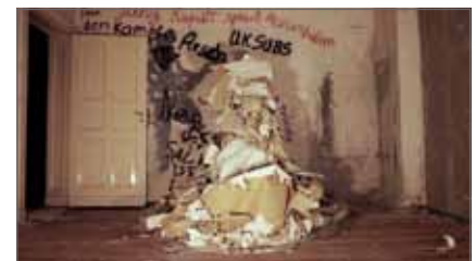
limited space