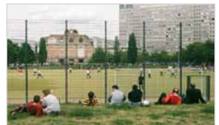
limited space