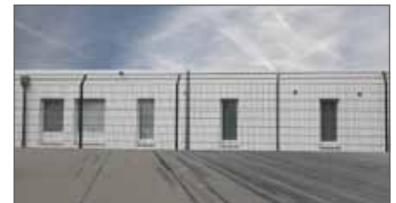
limited space