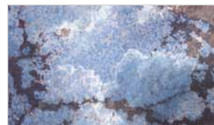
limited space