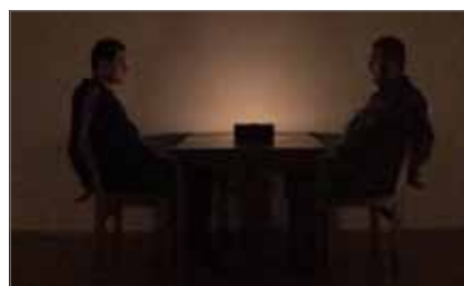
limited space © THE BOX/ Anel Lepic & Bakir Terzimehic