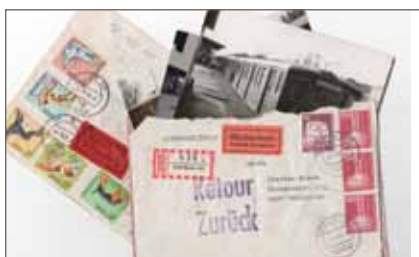
limited space © STEFAN WIESE/ Sungeun Kim