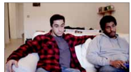
limited space © NUR DER KÄSE IN DER MAUSEFALLE IST UMSONST/ Andre Filatow