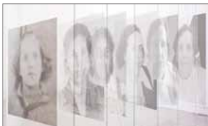
limited space