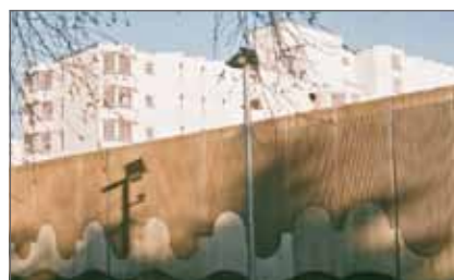
limited space