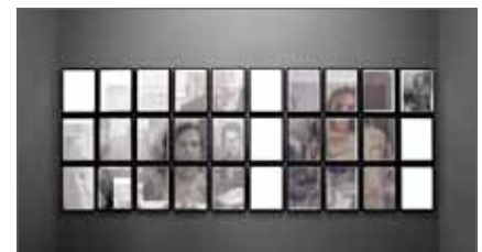
limited space

designtransfer is a gallery and transfer point for the design faculty of the University of the Arts, Berlin. As a communication platform between the University and the public, designtransfer presents current design work, organizes events around the topic of design, and acts as cooperation partner for external projects and competitions.